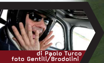
di Paolo Turco